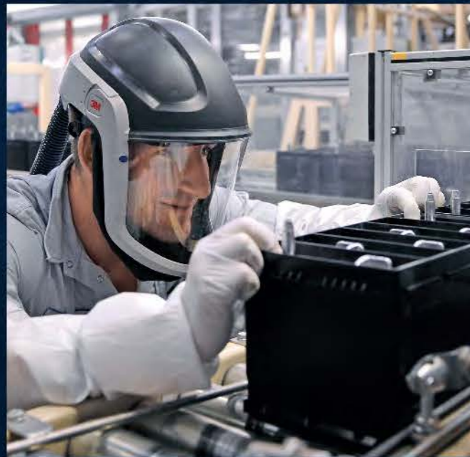
Khảo sát tại nhà máy sản xuất ắc quy tại Hanover.

Ắc quy VARTA đại diện cho chất lượng vượt trội. Đó là lý do các nhà sản xuất ô tô xem đây là lựa chọn tốt nhất cho sản phẩm của mình. Tuy nhiên, bên cạnh yếu tố chất lượng, còn nhiều lý do quan trọng khác khiến VARTA luôn là sự lựa chọn đầu tiên.