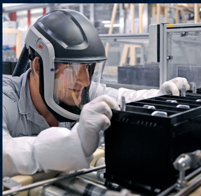
歐洲製造的電池在漢諾威工廠檢查。

VARTA 電池就是卓越品質的象徵。因此，汽車製造商均認為它最適合各類型汽車使用。然而，除了質量方面以外，另外還有許多重要原因致使 VARTA 電池成為他們的首選。